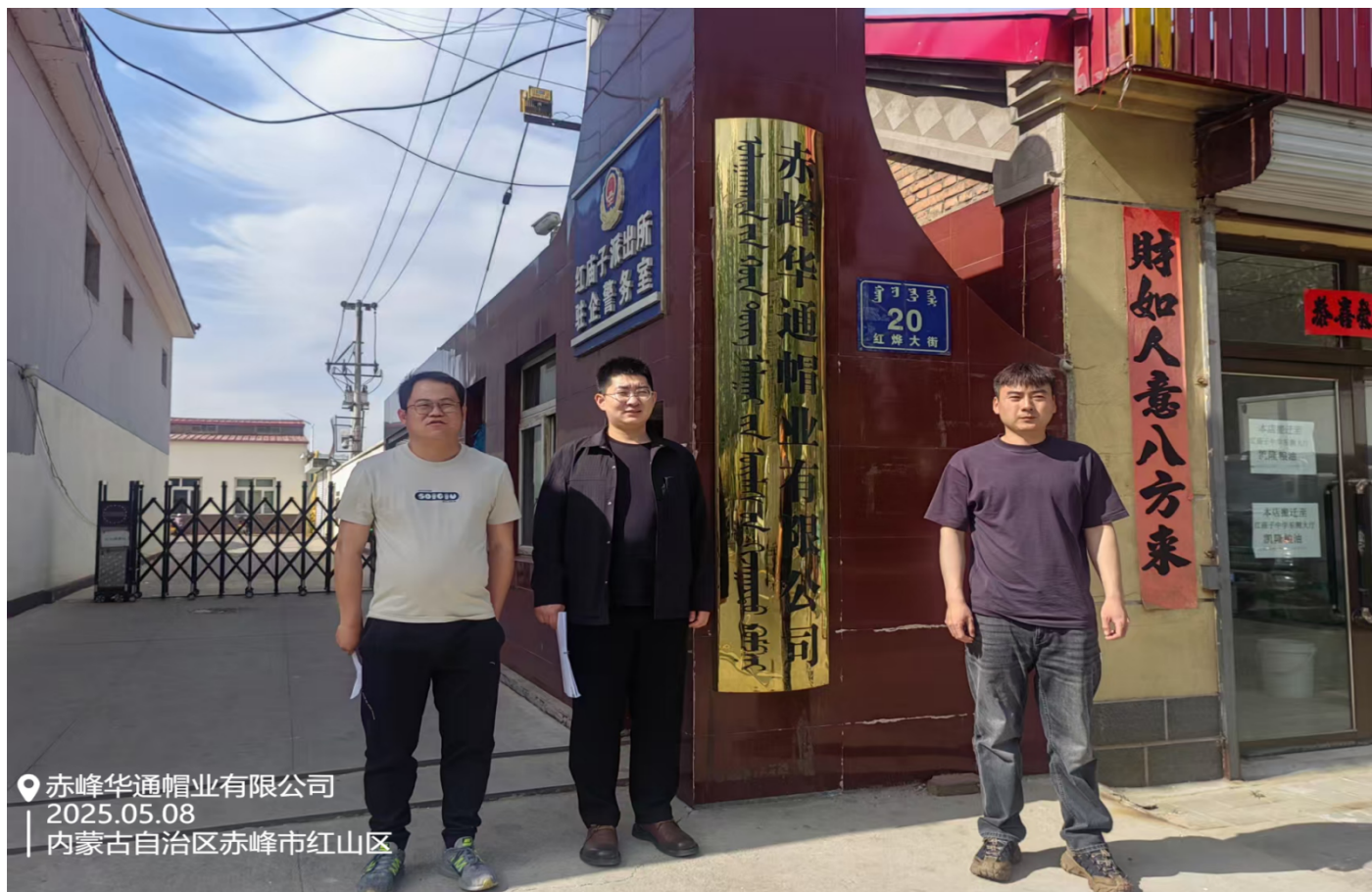
赤峰华通帽业有限公司 2025.05.08 内蒙古自治区赤峰市红山区